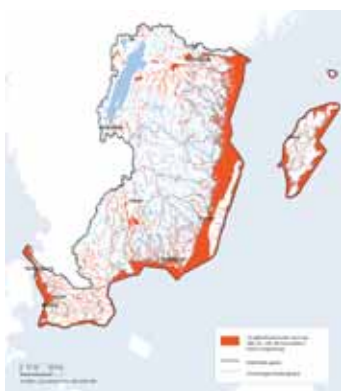
Röda områden visar ytvattenförekomster som har eller är i risk för att ha problem med övergödning.

Under projektiden anordnades en temadag i juni för länets handläggare på bygg, plan- och miljösidan. Syftet med dagen var att visa hur man använder databasen VISS, som bland annat ger information om statusen på våra vatten.