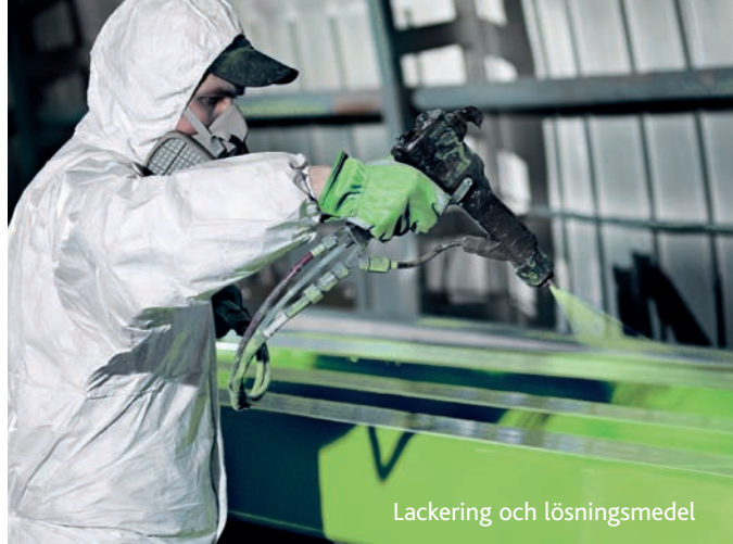
Lackering och lösningsmedel